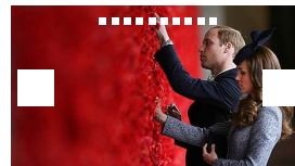
Австралийское турне королевской семьи